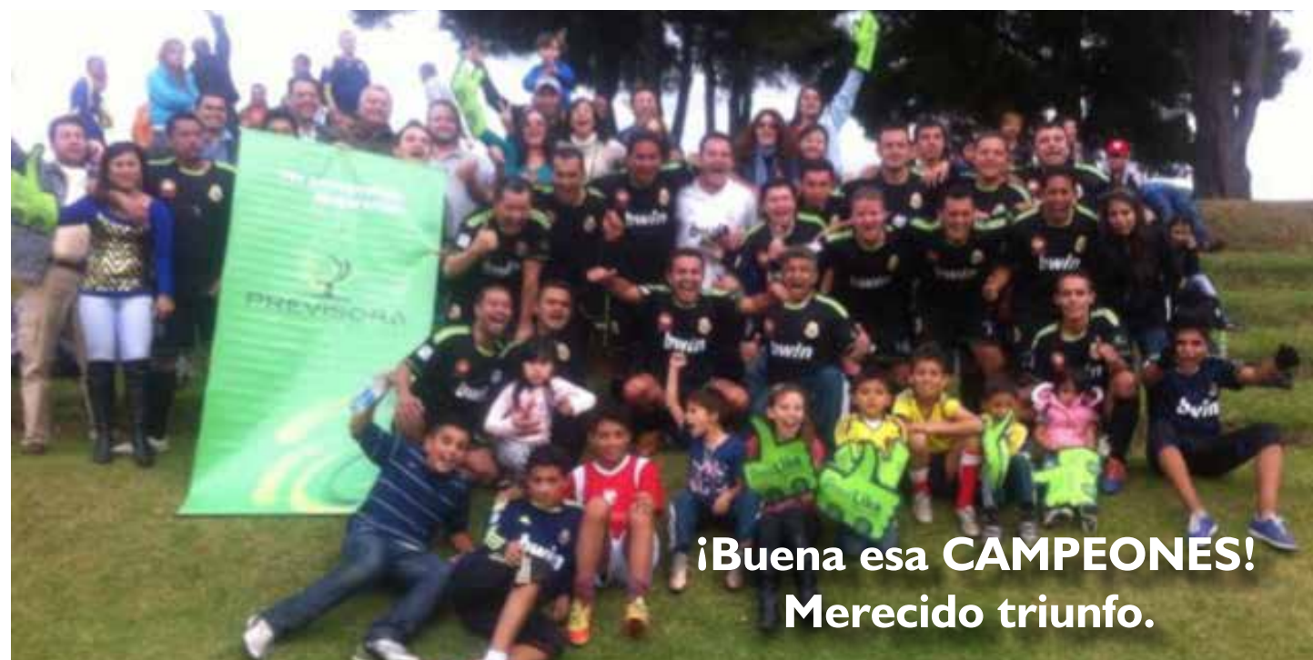
¡Buena esa CAMPEONES! Merecido triunfo.

Con la compañía de un importante número de trabajadores y una alborozada barra, el equipo de fútbol patrocinado por SINTRAPREVI y LA PREVISORA se enfrentó en la final contra Seguros del Estado en el Torneo de Fútbol Fasecolda 2013.